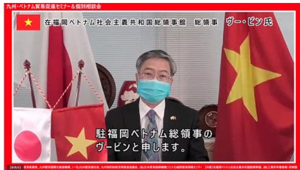
在福岡ベトナム社会主義共和国総領事館 ヴー・ビン総領事