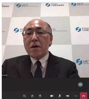
九州経済産業局 国際部長 飛矢崎峰夫