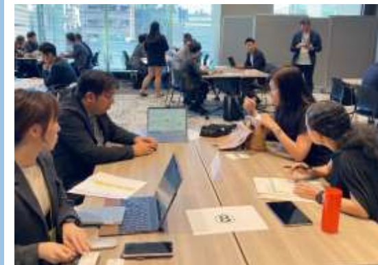
F CUBE INNOVATION 與參與企業進行商談