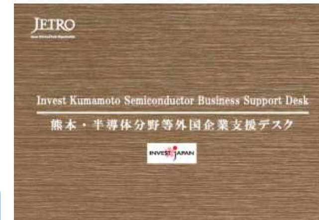
辦公室看板示意圖