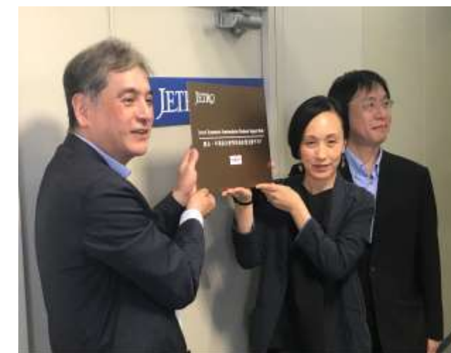
設置熊本支援小組的情形