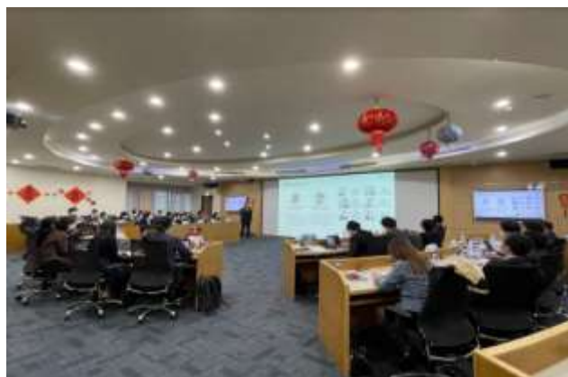
2022年度事業的情形 (在新竹科學園區交流)