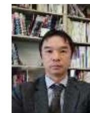
石橋 洋一郎 駐：非洲、歐洲