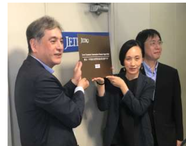
熊本支援デスク設置の様子