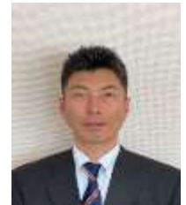
中村 志信 駐：中東