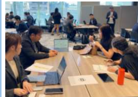
F CUBE INNOVATION 登壇企業との商談