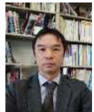
石橋 洋一郎 駐：アフリカ、欧州