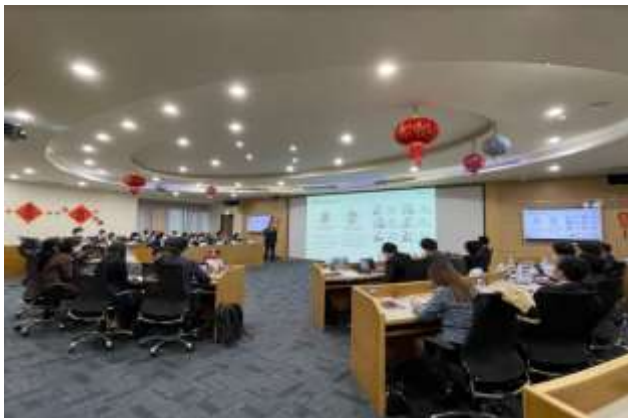
2022年度事業の様子 (新竹サイエンスパークでのネットワーキング)

<期 間>2023年10月11日(水)～15日(日) <参加者>在福岡スタートアップ <内 容>Taiwan Innotech Expo 2023に ブース出展し台湾へのビジネス展開を模索 <経 緯>2022年度に訪問したITRIの提案で 実施。今後も双方スタートアップの支援体制 構築に向けた協議を行っていく予定