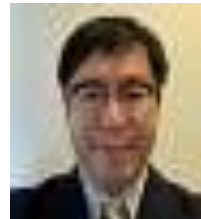
斉藤 浩史 駐：アジア