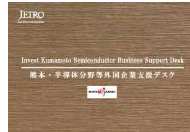
オフィス看板イメージ